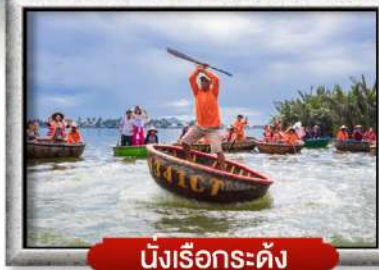
นั้งเรือกะดั่ง