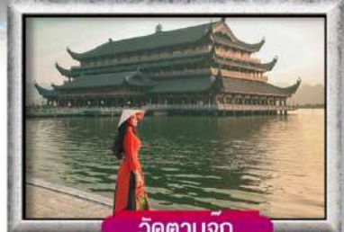
วัดตามจุก

เมนู สุดพิเศษ เมนูชาบูปลาแซลมอน + ไวน์แดง 4 วัน 3 คืน อาหาร : 8 มื้อ เดินทาง พ.ศ. 65 เป็นต้นไป