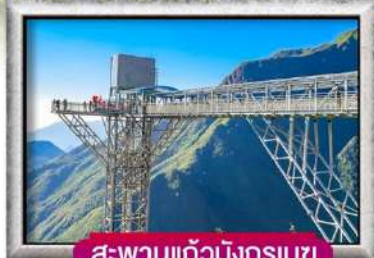
สะพานแก้วมิงกรเมซ