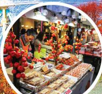
ย่านเมียงดง (MYEONG-DONG)