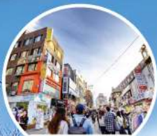
ย่านฮงแด (HONGDAE)