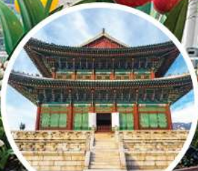
พระราชวังเคียงบกกุง (Gyeongbokgung Palace)