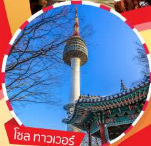
โซล ทาวเวอร์